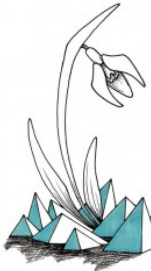
( http://kulturshot.dk/sneskud-mere-varme-i-vi/ )