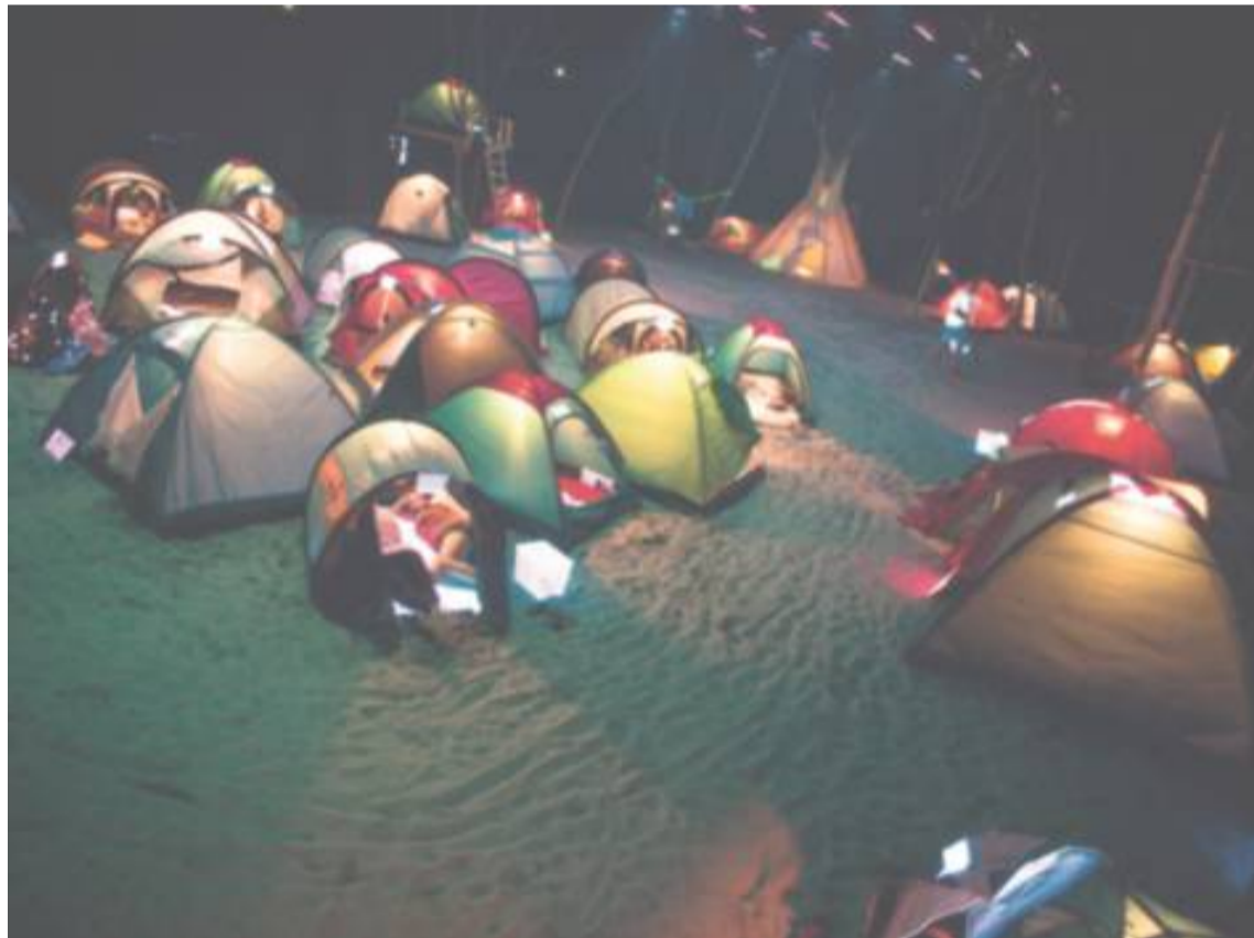
Mørket har sænket sig over lejren med 35 festivaltelte, hvor både de medvirkende og publikum indkvarteres under forestillingen.