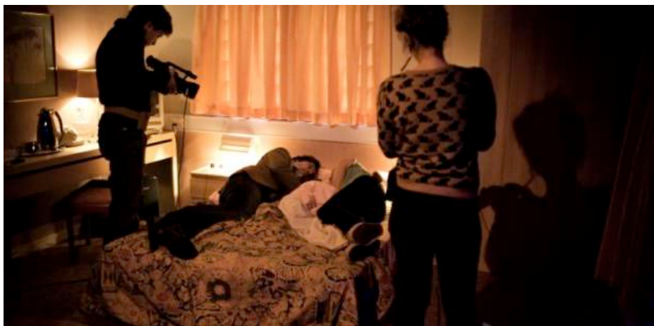
Teaterstykket 'Pretty Woman A/S' filmes og vises undervejs i forestillingen.